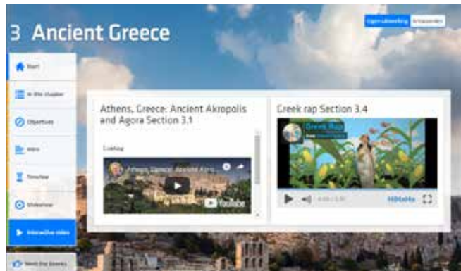
D Interactive video

Aan de linkerkant van deze webpagina bevinden zich alle opties: